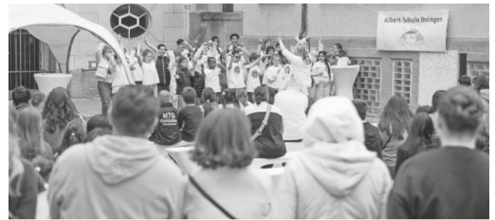
Auftritt des 6k united Chors

Die gesamte Schulgemeinschaft freute sich über die vielen Besucherinnen und Besucher sowie das große Interesse an der Albert-Schule. Ein herzlicher Dank gilt allen Helferinnen und Helfern, die mit ihrem Einsatz zu diesem gelungenen Fest beigetragen haben.