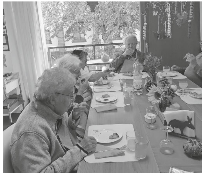
Herbstfest in der Tagesbetreuung mit Neuem Wein und Zwiebelkuchen