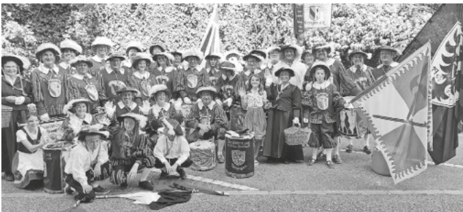
Gruppenfoto FFZ Ihringen und Teningen

Lust nächstes Mal aktiv dabei zu sein? Wir freuen uns immer über neue Musiker in unseren Reihen :-)