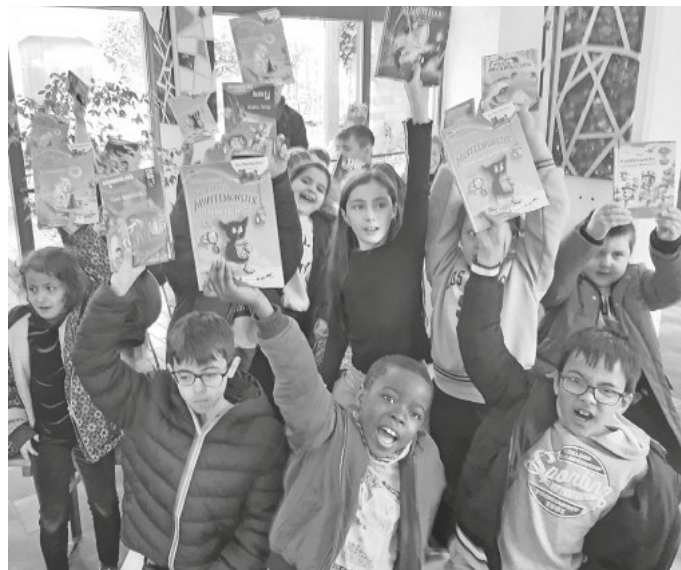
Zeigt her Eure Bücher: Fröhliche Schülerinnen und Schüler der Albert-Schule nach der Übergabe

„Schon Noah wusste, die Arche ist die beste Wahl “