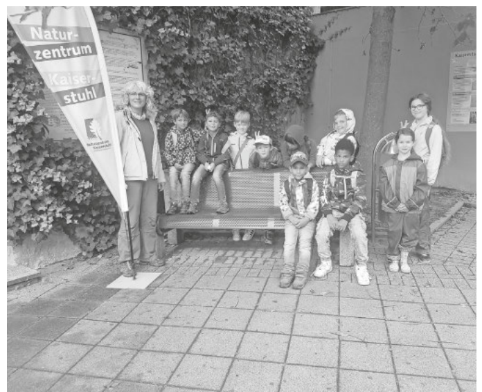
Vulkanismus am Kaiserstuhl