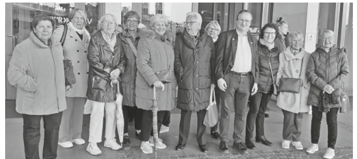
Seniorinnen und Senioren besuchen Symphonie-Konzert